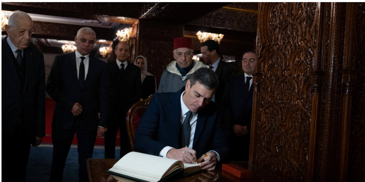
El presidente del Gobierno, Pedro Sánchez, firma en el Libro de Oro durante su visita al Mausoleo de Mohamed V, en Rabat (Marruecos).

Marruecos, país colindante a nosotros en la frontera sur, está compuesto de 37 millones de habitantes y, desde su independencia, ha reclamado territorios españoles que nunca han estado bajo su soberanía. Para ello, ha presionado a España a través de diversas herramientas y moviéndose de forma hábil en una zona gris. En la actualidad, Marruecos es un actor cuya influencia en nuestro territorio nacional es notoria, con ambiciones que se expresan cada vez de forma más clara y contundente 3 . Esto hace que sea de imperiosa necesidad conocer con la mayor profundidad posible cómo las autoridades políticas marroquíes están utilizando -o tratando de utilizar- a sus abundantes residentes en nuestro suelo y cómo intentan que los españoles de origen marroquí sientan que su lealtad debe decantarse por ‘ La Madre Patria ’.