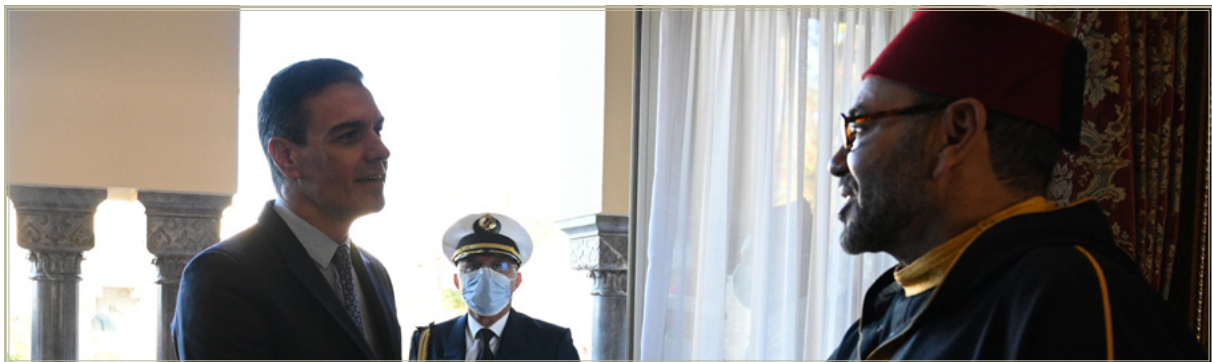
El presidente del Gobierno, Pedro Sánchez, durante su reunión con el Rey Mohamed VI en Rabat

crucial en el presente y en el futuro inmediato, y aquí hemos de ser también particularmente cuidadosos. Ante la dificultad de recuperar la relación con Argel en las circunstancias actuales, asunto que debería ser considerado de interés nacional dado el altísimo precio que estamos pagando y que seguiremos sufriendo por su sacrificio desde 2022. Importante será al menos que Marruecos no siga seguir quedando bien ante sectores españoles y de la UE presentando a Argelia como epicentro de todos los males –en términos migratorios irregulares, de radicalización islamista o de proyección de amenaza yihadista, energéticos o de supuesta alianza con Rusia, entre otras rémoras– y a sí mismo como paladín para la defensa de España y de Europa frente a aquellos 35 . El conocimiento profundo que a España le da la experiencia acumulada de su vecindad doble, con Marruecos y con Argelia, y en una aproximación más amplia con la subregión del Magreb, nos debería de permitir ser capaces de transmitir con claridad los riesgos y las amenazas a las que Europa se enfrenta hoy y se enfrentará en el futuro en esta vecindad meridional, evitando con ello caer en manipulaciones y tergiversaciones como las que Marruecos viene siendo capaz de transmitir, con éxito, desde hace décadas.