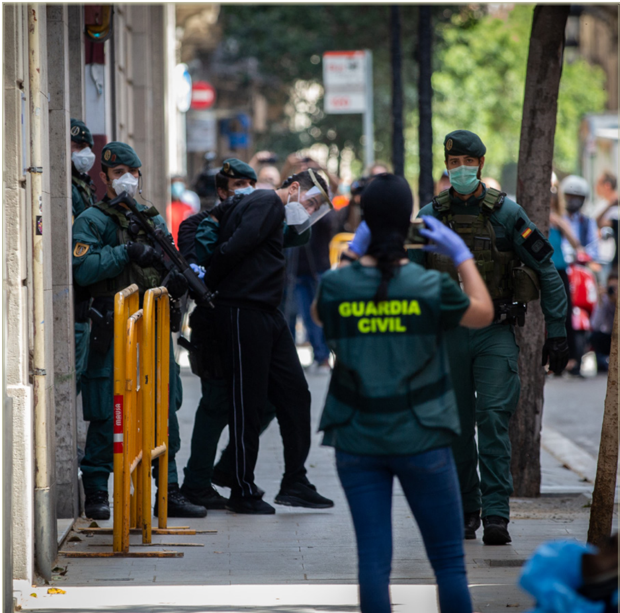
Agentes de la Guardia Civil detienen a un yihadista en Barcelona.

sentencias firmes, preocupa en particular la labor de proselitismo de aquellos sobre los compatriotas que son presos comunes. En 2018 el número de presos yihadistas en 28 centros penitenciarios era de 151 –110 más que en 2012–, siendo el 48 % de ellos marroquíes. A modo de ejemplo, en 2021 se detectaron presiones de presos yihadistas marroquíes otros compatriotas suyos en el Centro Penitenciario guipuzcoano de Martutene para que fueran cumplidores con las exigencias del islam y para que acataran los criterios islamistas más radicales, tal y como reflejaba en un Informe sobre las Prisiones publicado por el Ministerio del Interior en agosto de 2022.