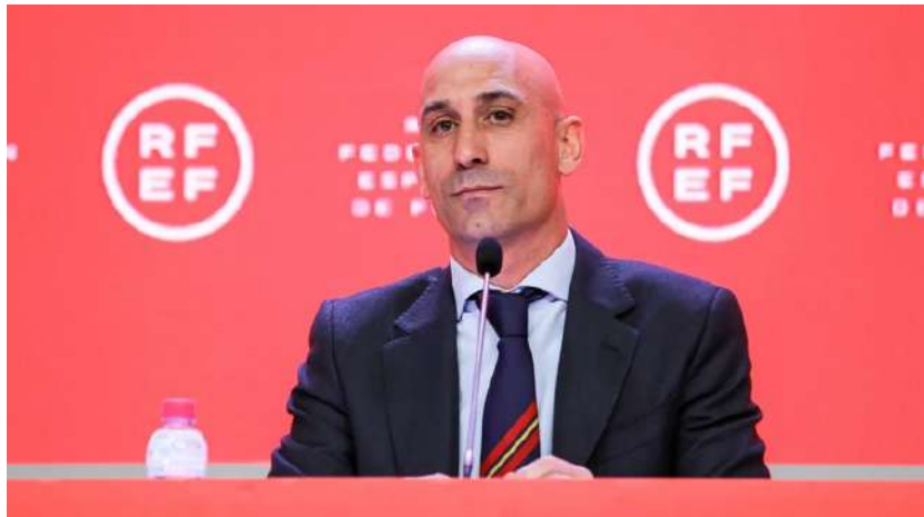
El expresidente de la RFEF Luis Rubiales en abril de 2022.

La asociación que se querelló contra los contratos alega que el CSD debió inhabilitar a Rubiales