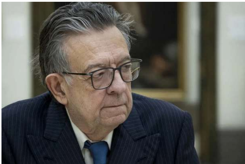
Miguel Herrero de Miñón.