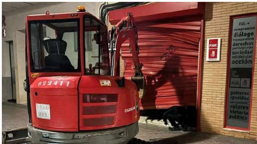
Sede del PSOE en Badajoz después del ataque.

El abogado pide la medida de gracia concedida a los separatistas catalanes alegando el principio de igualdad ante la ley