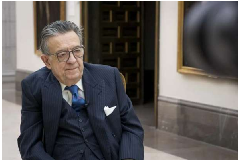
Miguel Herrero de Miñón.

R.-Sinceramente, yo no lo esperaba. Y he de confesar que lo que más me ha sorprendido ha sido el PNV, con el que yo tenía una magnífica relación. Apreciaba mucho a sus dirigentes. Creo que, en ese momento, no se supo hablar sinceramente con los dirigentes del PNV. Y el PNV, claro, ha derivado a autocrearse un partido de izquierda progresista, cuando es el partido más conservador de España.