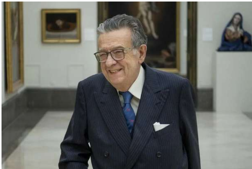
Miguel Herrero de Miñón. | Víctor Ubiña

R.- Bueno, la situación actual es disparatada, pero no es catastrófica. Es disparatada, porque se hacen disparates y se anuncian. No se hacen, se anuncian.