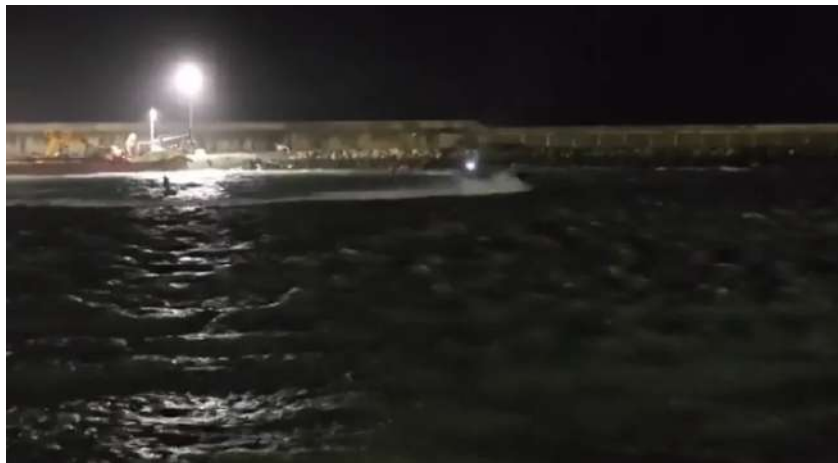
El momento en que la narcolancha embiste a la Guardia Civil. | TO

Los seis investigados por los dos asesinatos aseguran que grabaron con un móvil el suceso desde otra lancha