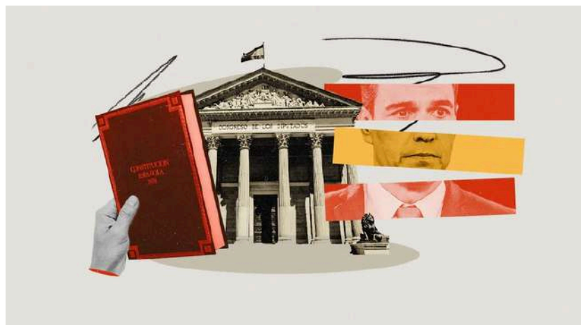
Ilustración de Alejandra Svriz.

«La ley de amnistía permite a los enemigos del pacto constitucional reescribir la historia y diseñar nuestro futuro»