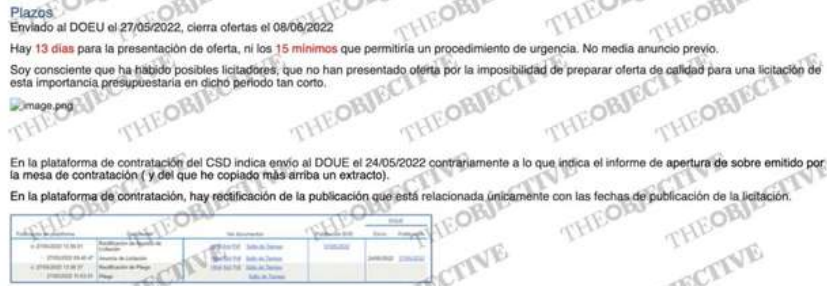
La segunda parte del correo electrónico.

Además, en el correo subrayó las consecuencias que se crearon tras reducir el plazo de presentación de ofertas a los 13 días. «Soy consciente que ha habido posibles licitadores que no han presentado oferta por la imposibilidad de preparar oferta de calidad para una licitación de esta importancia presupuestaria en dicho periodo tan corto». También señaló el lío con las fechas para presentar ofertas en la licitación: «En la plataforma de contratación del CSD indica que el envío al DOUE fue el 24 de mayo de 2022, contrariamente a lo que indica el informe de apertura de sobre emitido por la mesa de contratación».