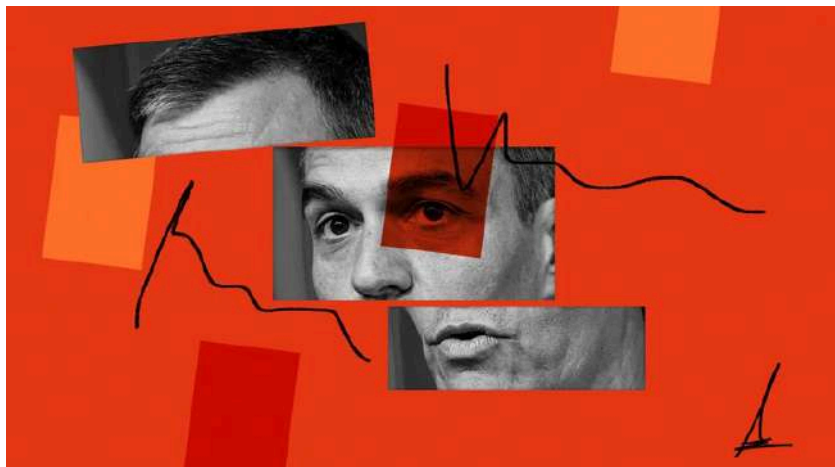
Ilustración de Alejandra Svriz.

«Presidente, haga como Yolanda Díaz, mándenlos a la mierda. En resumen, es lo mismo, pero más directo. Y no hay nada más importante que no ser un coñazo»