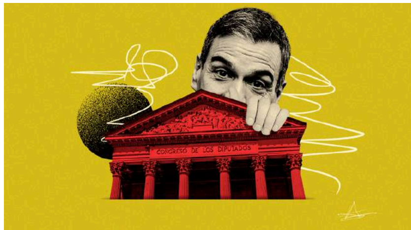
Ilustración de Alejandra Svriz.

«Paradójicamente, es de la izquierda democrática de donde procede entre nosotros la principal amenaza de un ingreso resuelto en la política del Mal»