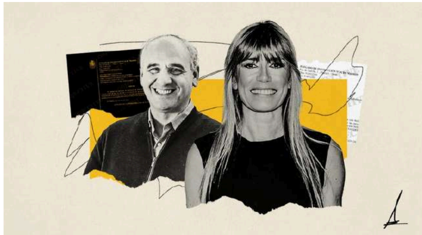
Begoña Gómez recomendó a Innova Next en un contrato público anterior.

La oferta de su principal rival, que perdió por unas décimas, era un 40% inferior en coste