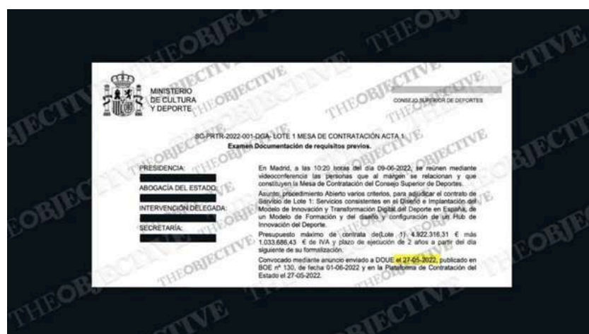
La fecha de una de las actas del órgano de asistencia de la licitación.

La ley de Contratos del Sector Público y el Real Decreto-ley 36/2020 de la covid-19 limitan el plazo de presentación de ofertas a un mínimo de 15 días naturales. En esta licitación a la que acudió Barrabés, el plazo se cerró el 8 de junio de 2022 y se abrió en el momento del anuncio del envío de licitación al Diario Oficial de la Unión Europea (DOUE), por ser un contrato sujeto a regulación armonizada (es decir, que se abre a libre competencia de la UE). Así, las diversas actas firmadas entre el 27 de mayo y el 7 de julio del órgano de asistencia -que estaba compuesto, entre otros, por una abogada del Estado y un interventor delegado- demuestran que el anuncio enviado al diario de la Unión fue el pasado 27 de mayo de 2022. Por lo que se cumplieron 13 días naturales, menos de los exigidos por ley.