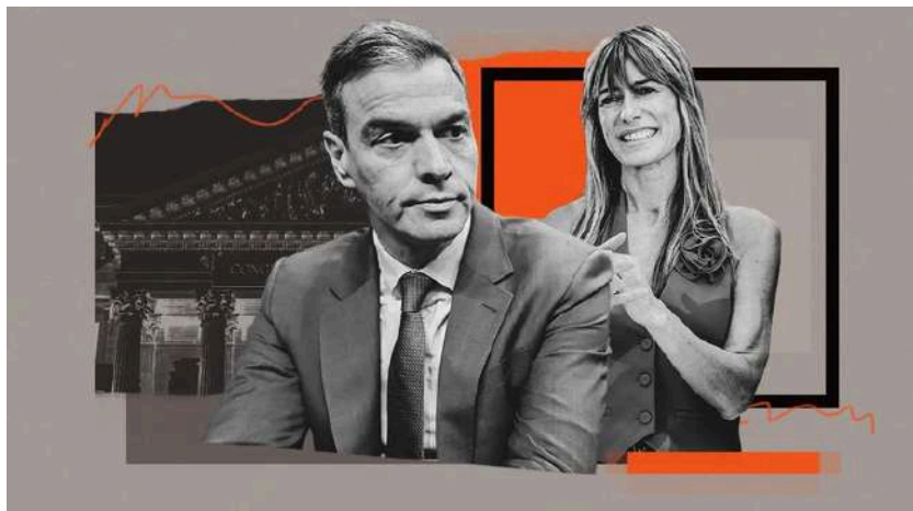
Ilustración de Alejandra Svriz.

«¿Se da cuenta de que es usted el único que parece desconfiar de la justicia y no aceptar las reglas del Estado de derecho y rebelarse contra ellas?»