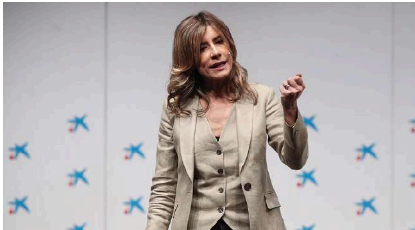
La mujer del presidente del Gobierno, Begoña Gómez.

El plazo de presentación de ofertas se cerró a los 13 días, cuando la ley obliga a un mínimo de 15