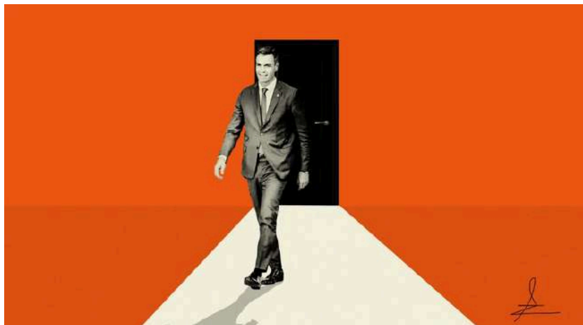
Ilustración de Alejandra Svriz.

«Ante cualquier empeño por cuestionar lo establecido y asentado, siempre alza su protesta alguno de los que tienen su sillón puesto en la dirección de lo vigente»