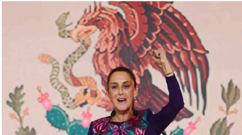
Claudia Sheinbaum, ganadora de las elecciones generales mexicanas.

«La arrolladora victoria de Claudia Sheinbaum puede significar, si cumple las reformas constitucionales prometidas, la cuenta atrás para la democracia»