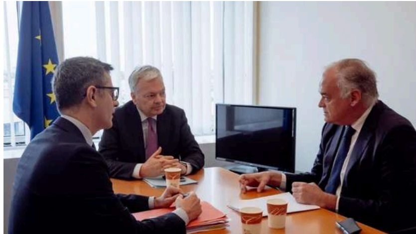
(I-D) El ministro de Presidencia, Justicia y Relaciones con las Cortes del Gobierno de España, Félix Bolaños; el comisario europeo de Justicia Didier Reynders y el vicesecretario de Institucional del PP, Esteban González Pons, durante una reunión en el Pa - Unión Europea - Europa Press

THE OBJECTIVE hace varios meses, la intención de Pedro Sánchez es nombrar tanto al gobernador como al subgobernador del supervisor, dejando fuera al PP , si no se avienen a un pacto para el CGPJ. «Yo tengo la idea de que el PP va a continuar con el bloqueo, ojalá me equivoque... ».