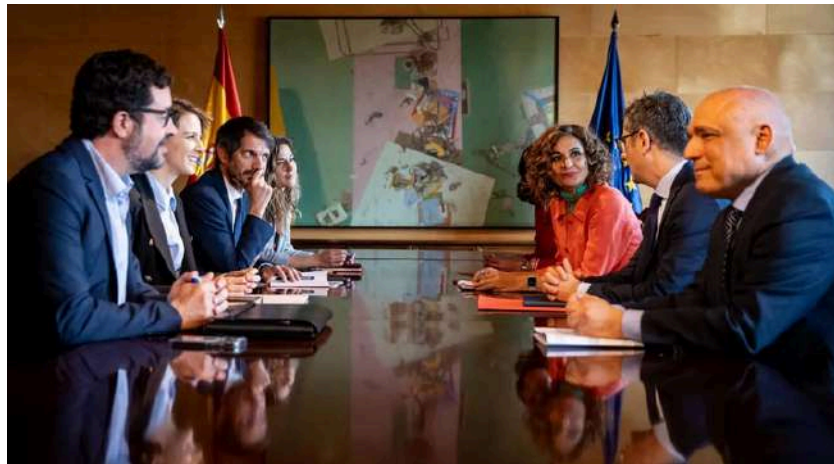
Reunión entre representantes de Sumar y del PSOE.

La mayoría parlamentarias necesaria irá primero de reforzada a absoluta y luego a simple