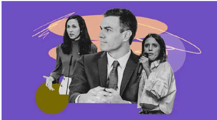
Ilustración de Alejandra Svriz.

«El grado de infantilización de nuestra política está rozando una vida en pañales. Como si en este país solo supiéramos comer y llorar»