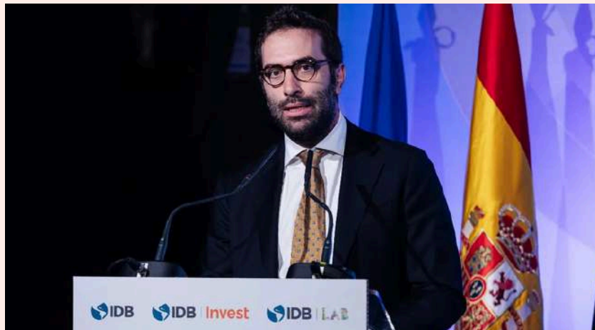
Carlos Cuerpo, ministro de Economía.

Esta herramienta fue incorporada en 2020 y endurecida en la ley de inversión extranjera en verano del año pasado