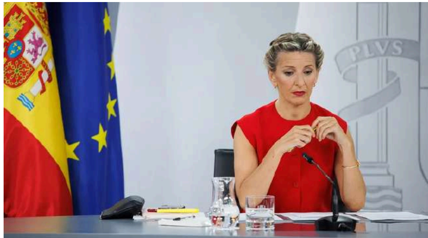
La vicepresidenta segunda y ministra de Trabajo y Economía Social, Yolanda Díaz, durante una rueda de prensa posterior a la reunión del Consejo de Ministros, a 21 de mayo de 2024, en Madrid.

El coste laboral teórico del exceso de asalariados públicos sería del 5% del PIB anual, según un estudio del CEU