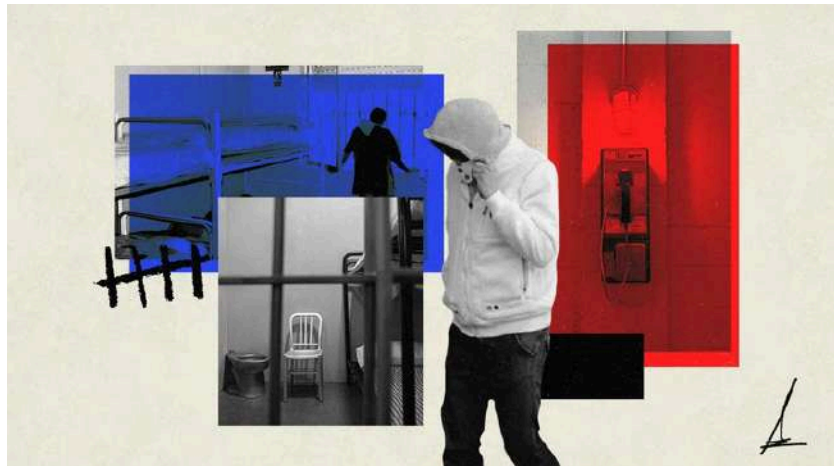
Ilustración de Alejandra Svriz.

Casi el 60% de los jóvenes encarcelados en España han nacido en otro país: 868 de 1.513