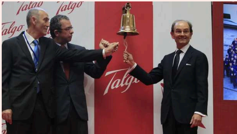
Salida a bolsa de Talgo, empresa en la que quiere entrar Magyar Vagon y para la que ha solicitado su entrada al Gobierno a través del comité de inversión.

Las fuentes consultadas indican que el hecho de que no se rechacen expedientes no significa que el Gobierno tenga menos injerencia. Al contrario, advierten que es una fórmula para evitar generar revuelo entre el mundo inversor. Para ello, hay veces que frenan proyectos incluso antes de que se presenten y otras fuerzan a que se retire la petición, como ya ha pasado en casos como el de Vivendi en 2021. El grupo francés dejó sin vigor su propuesta al recibir el imput negativo del Ejecutivo.