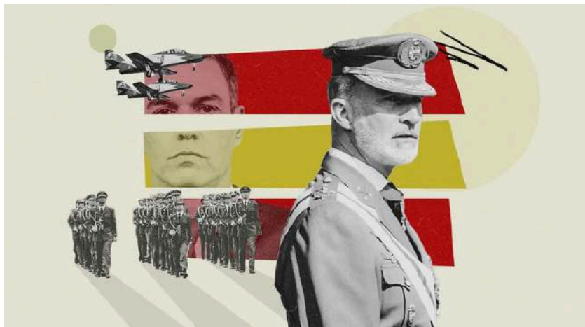
Ilustración de Alejandra Svriz.

«El Rey ha sabido convencer a la ciudadanía de su utilidad en tiempos de gran crispación política como los actuales»