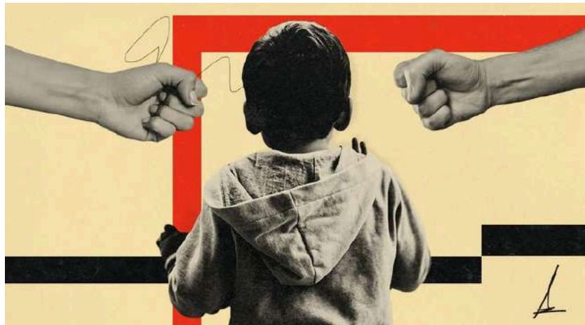
Ilustración de Alejandra Svriz.

El Gobierno sólo registra los asesinatos de menores a manos de sus padres e ignora los cometidos por mujeres