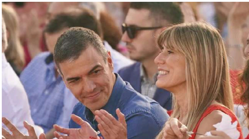
Pedro Sánchez junto a su esposa, Begoña Gómez, en un acto de campaña por el 9J.

«Estamos asistiendo a una mutación constitucional orquestada por el populismo sanchista que nos aboca a una dictadura plebiscitaria»