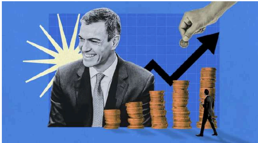
Ilustración de Alejandra Svriz.

«Sería ingenuo pensar que cuando Sánchez convierte en un mercado persa la asignación de fondos europeos, su mujer se iba a quedar en casa haciendo calceta»