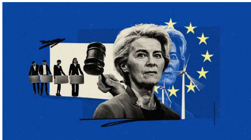
Ilustración de Alejandra Svriz.

«Es imprescindible votar para mantener con vida a Europa. Sobre todo aquellos que ya están amenazados por gobiernos autoritarios y corruptos como el nuestro»