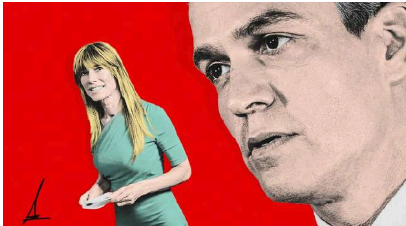
Ilustración de Alejandra Svriz.

«La culpa es doble. La notoria imprudencia de la señora Gómez y de su marido y la falta de una Oficina de Conflictos eficaz y neutral como la británica»