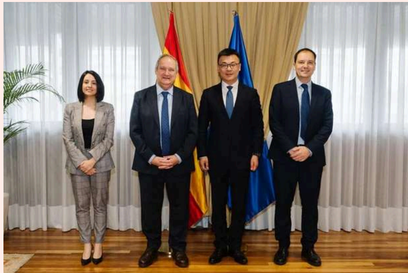
Reunión de Jordi Hereu con los representantes del fabricante de coches eléctricos chino, Chery, donde les instó a participar en el Perte VEC Y en el reparto de fondos europeos.

chinas en el proceso español de reindustrialización», indicó y recordó su inversión de al menos 500 millones como ejemplo de colaboración. Pidió formalmente que España fuese su «embajador» ante la Unión Europea en este tema, una solicitud que sorprendió en Europa.