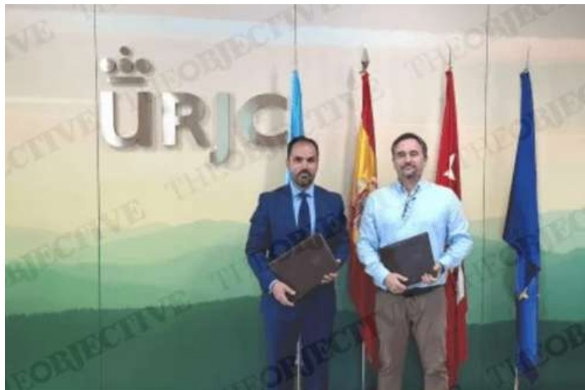
FIRMA DEL ACUERDO ENTRE LA URJC Y LA EMPRESA DE BARRABÉS. 'CASO BEGOÑA GÓMEZ': LA UCO REGISTRA LA SEDE DE RED.ES POR ORDEN DE LA FISCALÍA EUROPEA

Desde la universidad explicaron que «el convenio firmado es un protocolo general de actuación (PGA) que comprende varias acciones conjuntas a desarrollar en los próximos tres años. Entre ellas, las principales son colaborar en trabajos de carácter científico-técnico, cooperar en programas de formación e intercambiar personal investigador». Además, según anunciaron, «se espera que ambas instituciones cooperen en proyectos de difusión tecnológica y organicen jornadas, ciclos y seminarios. Otro de los objetivos que se pretende es ofrecer la posibilidad a los alumnos de la URJC de realizar prácticas en la empresa Barrabés».