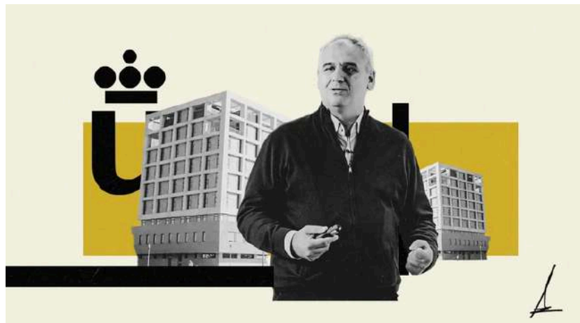
Ilustración de Alejandra Svriz.

La universidad pública llegó a un acuerdo con Barrabés antes de que el contrato saliese a licitación