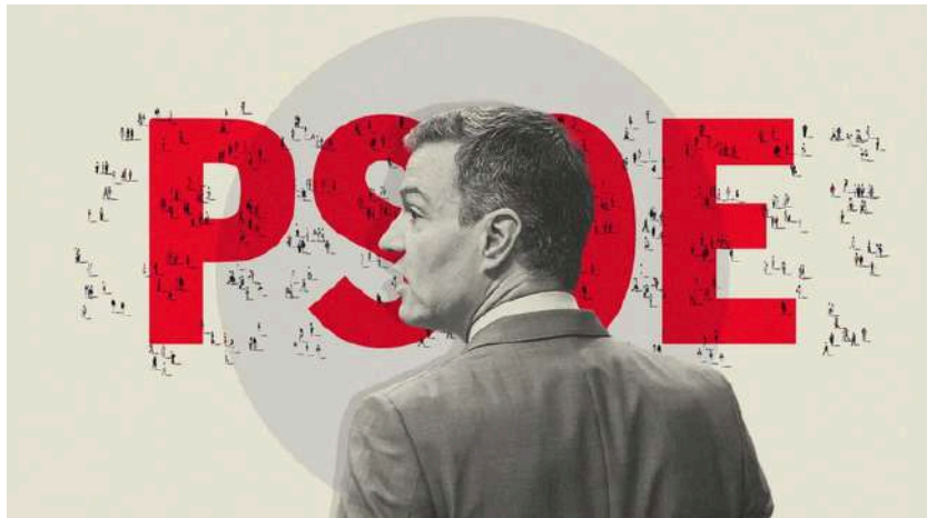
Pedro Sánchez | Ilustración de Alejandra Svriz

«Después de la amnistía, el 'caso Koldo' y el 'affaire' Begoña, el PSOE mantiene el 30% de los votos y se convierte en el partido socialista más fuerte de la UE»