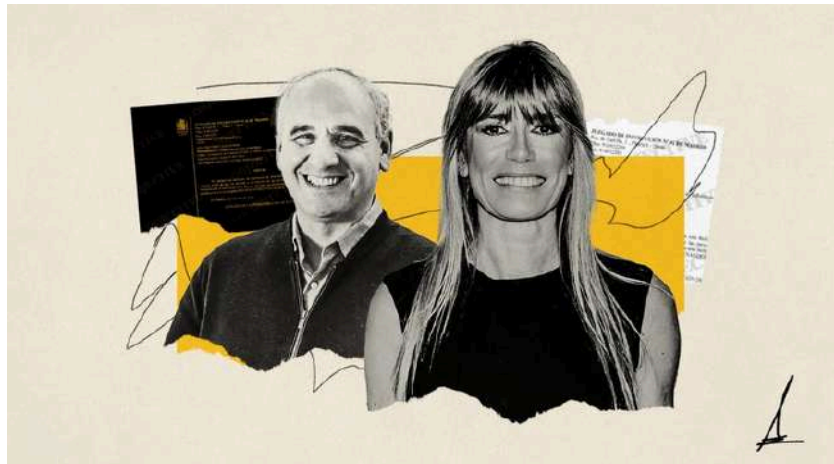
Ilustración de Alejandra Svriz.

Innova Next, recomendada por la mujer de Sánchez, pasó de ganar 58 euros en 2021 a 159.600 euros en 2022