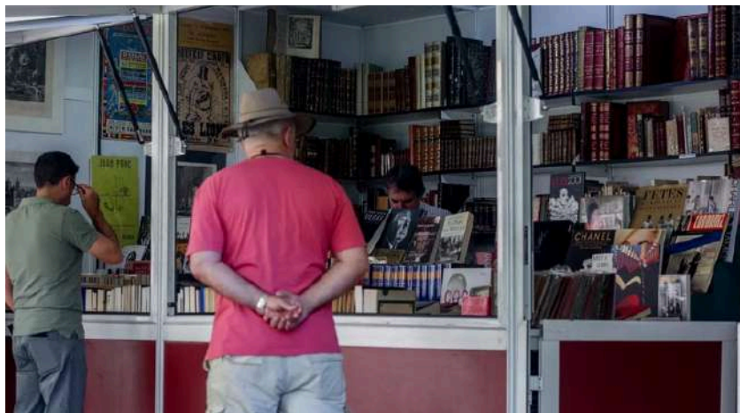
Un hombre paseando en la Feria del Libro.

«Uno también se construye en lo que lee, y el autor sobra. Todo autor está sostenido por la sombra luminosa de los lectores que no se han manifestado»