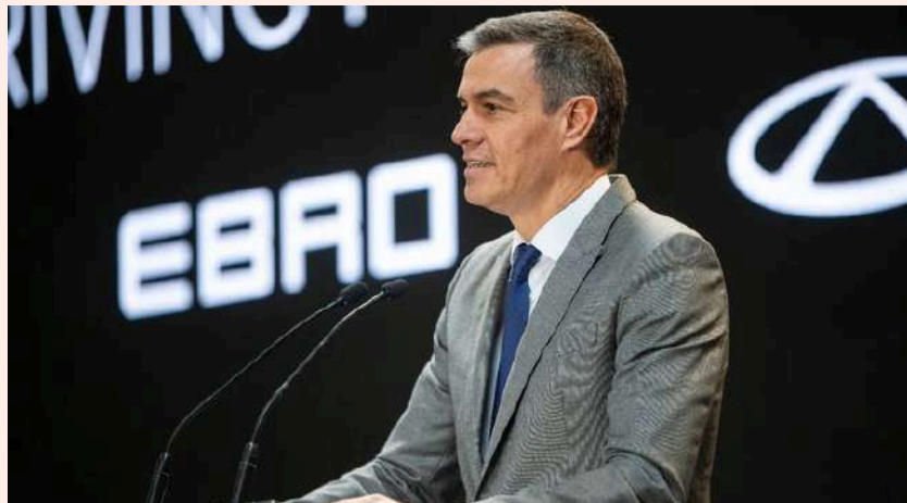
Pedro Sánchez, interviene durante el acto de la firma del acuerdo entre Ebro y Chery para construir coches eléctricos en la antigua fábrica de Nissan.

El ministro de Industria ha instado al fabricante de coches eléctricos Chery a participar en el nuevo tramo del Perte VEC