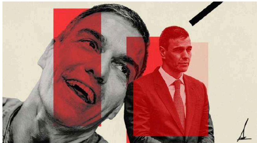
Ilustración de Alejandra Svriz.

«Solo alguien que no ha hablado en su vida con un chaval joven cree que este dejará de ver porno porque el Gobierno se ha inventado una aplicación»