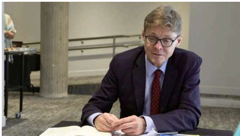
El relator de la ONU sobre ejecuciones extrajudiciales, Morris Tidball-Binz.

«Reiteramos asimismo que esas medidas deben estar encaminadas a preservar del olvido a la memoria colectiva y, en particular, evitar que surjan tesis revisionistas y negacionistas. Estas leyes, (propuestas o aprobadas) obstaculizarían el derecho a conocer la verdad y el derecho a la libertad de asociación», esgrimieron en el informe tras analizar las iniciativas del PP y Vox.