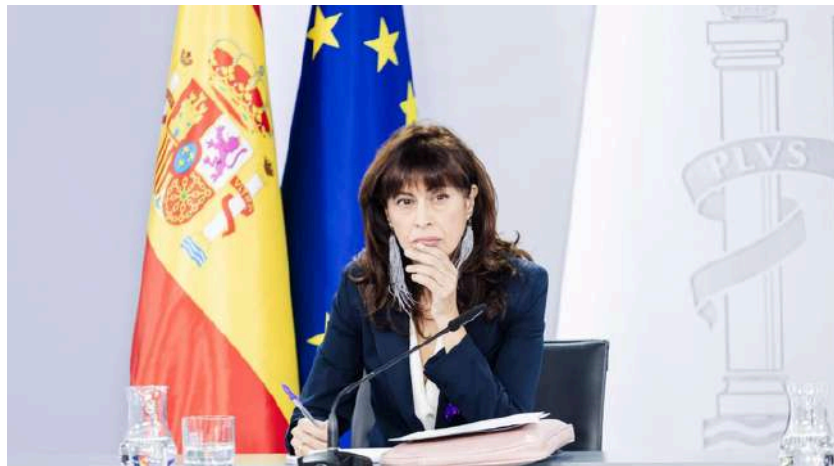
La ministra de Igualdad, Ana Redondo.

Los datos del Ministerio de Igualdad evidencian que el 12,6% de la población comete ya el 50% de los feminicidios