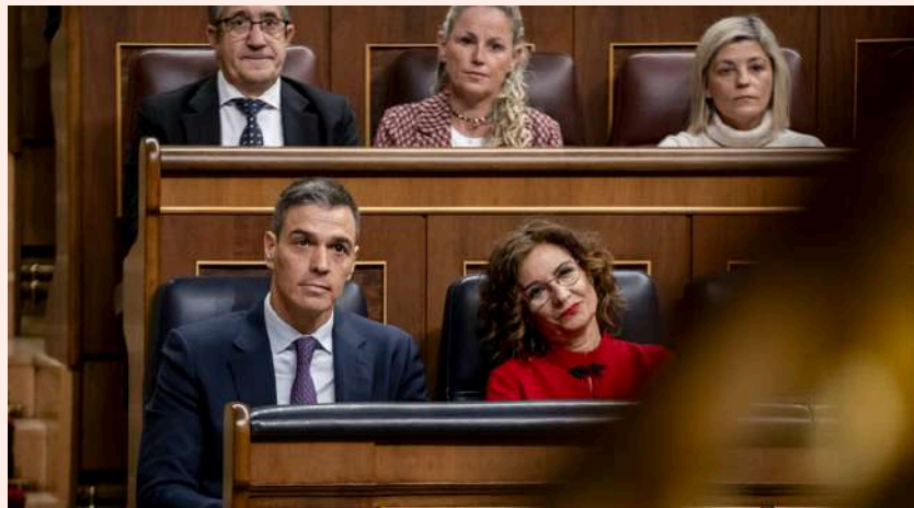
Pedro Sánchez y María Jesús Montero en la bancada del Gobierno en el Congreso de los Diputados.

Sin recibir el cuarto desembolso y sin pedir el quinto, nuestro país acumula un año sin percibir las ayudas europeas