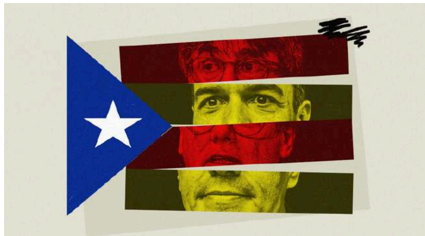
Ilustración de Alejandra Svriz.

«El pacto fiscal que ERC exige a Sanchez sería un cataclismo para la Hacienda Pública y crearía un daño irreparable a la equidad interterritorial»