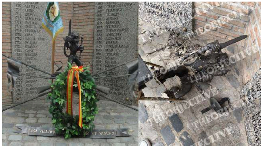
Monumento al regimiento Villaviciosa 14 antes y después de ser destrozado dentro del cuartel General Cavalcanti.

El acuartelamiento Cavalcanti investiga un acto de vandalismo contra el monolito del Regimiento Villaviciosa 14