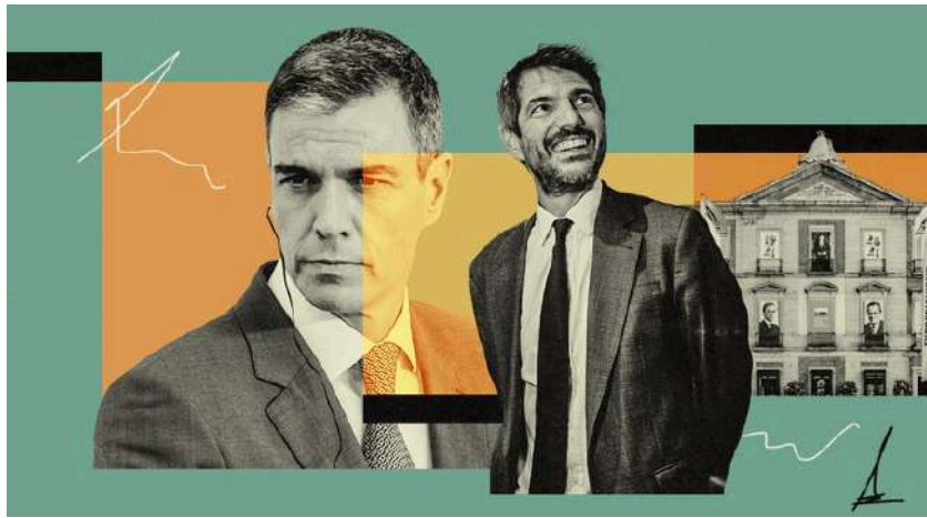
Ilustración de Alejandra Svriz.

«Hemos saltado de exaltar una Hispanidad remozada en el V Centenario a una demolición de la historia e identidad españolas en nombre de la 'decolonización'»