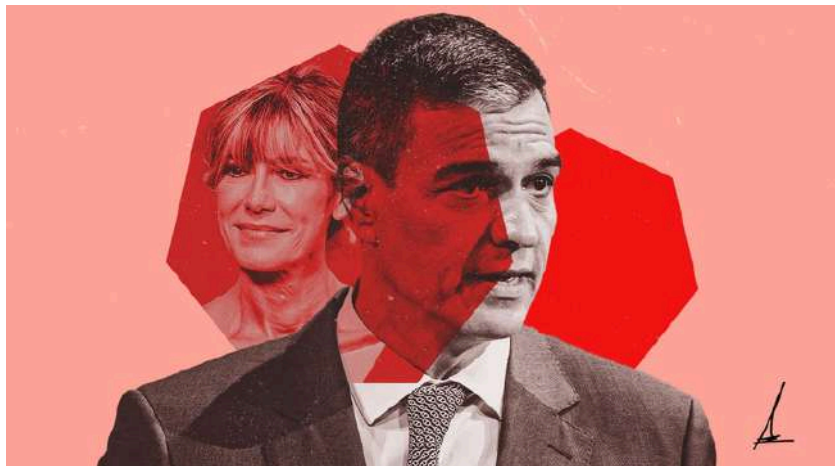
Ilustración de Alejandra Svriz.

«Los escándalos de la mujer del presidente ejemplifican el naufragio en el que estamos viviendo. Una sociedad a la que se le están arrebatando sus derechos»