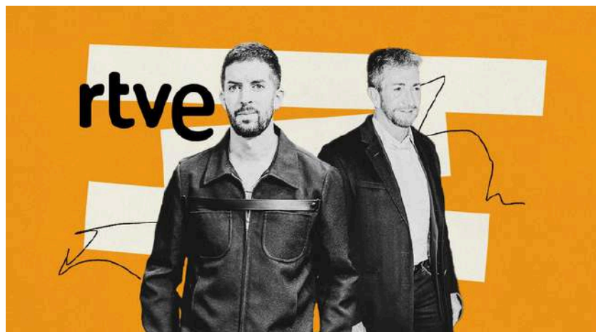
Ilustración de Alejandra Svriz.

«Su tertulia política irrita a quienes viven del conflicto. Quizá sea la discusión sosegada, lejos de extremismos y trincheras políticas, lo que da miedo»