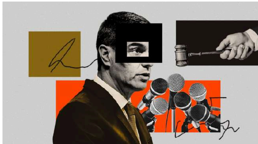
Ilustración de Alejandra Svriz.

«Sánchez es un experto en dejar las cosas a medias, hacer chapuzas jurídicas cuyo valor es estrictamente político, usar el BOE para la guerra cultural»