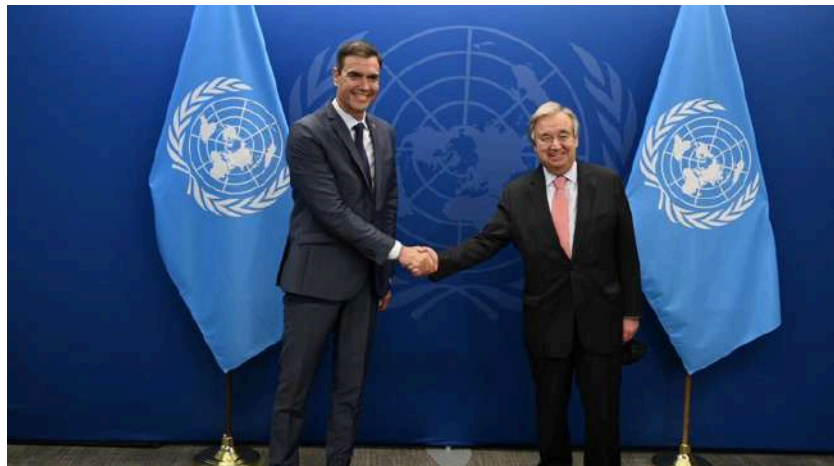
Pedro Sánchez y Antonio Guterres en la 77ª Asamblea General de la ONU.