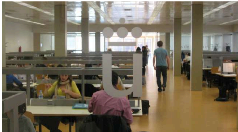
Biblioteca de la Universidad Rey Juan Carlos.

No se han cumplido los criterios que obligan a contratar docentes de prestigio y procedentes de otros centros