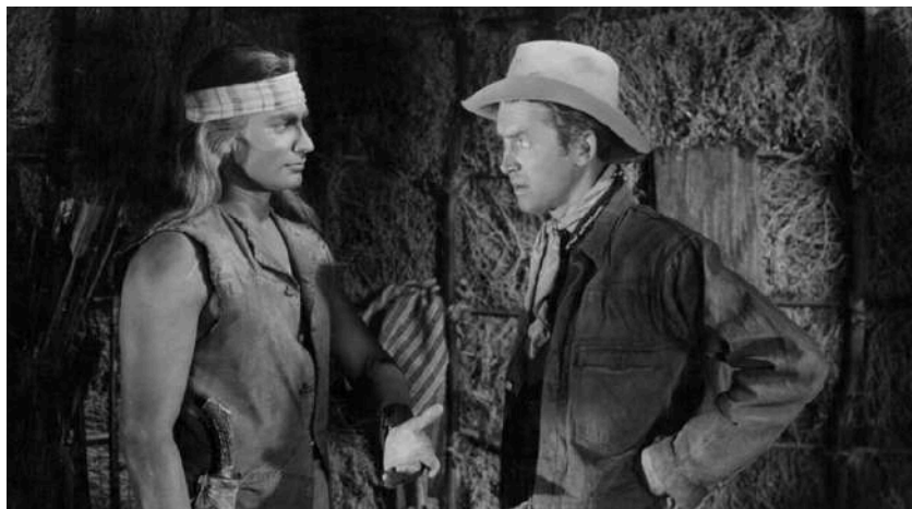
Jeff Chandler y James Stewart en 'Flecha rota'. | .

«Un blanco no puede ser Otelo, pero un negro puede interpretar al Rey Lear. Ventajas de pertenecer a una identidad-víctima en lugar de al machismo blanco»